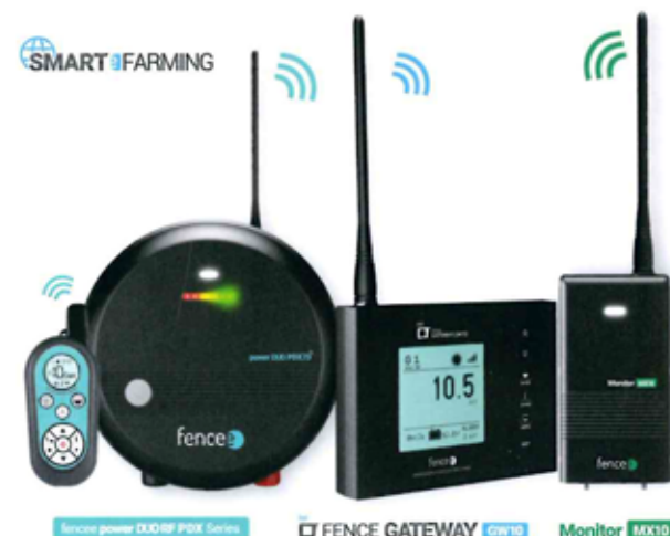
Jednotlivé zařízení chytré farmy

Na Gateway je možné napárat až šest generátorů. Velký displej na Gateway zobrazuje stav jednotlivých ohrad, napětí, výkon generátoru,