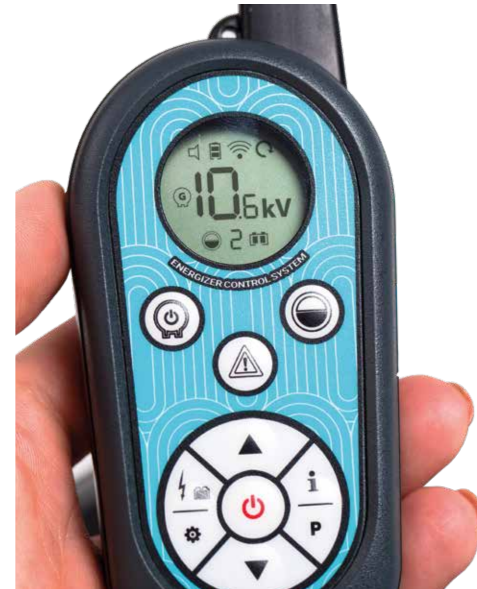
fencee power DUO RF PDX Hand